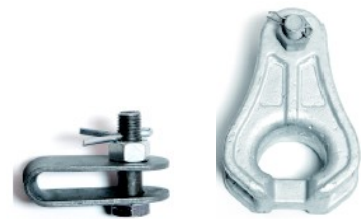
Коуш 10 кН